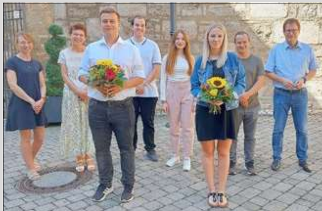
Im August wurden drei Auszubildende im Rathaus begrüßt; zwei wurden nach erfolgreicher abgeschlossener Ausbildung übernommen.

Fachdienst Personalwesen Tel.: 03601 - 452 123 Wir weisen darauf hin, dass nur vollständig und fristgerecht eingereichte Bewerbungen berücksichtigt werden. Kosten, die im Zusammenhang mit dem Bewerbungsverfahren entstehen, werden nicht erstattet.