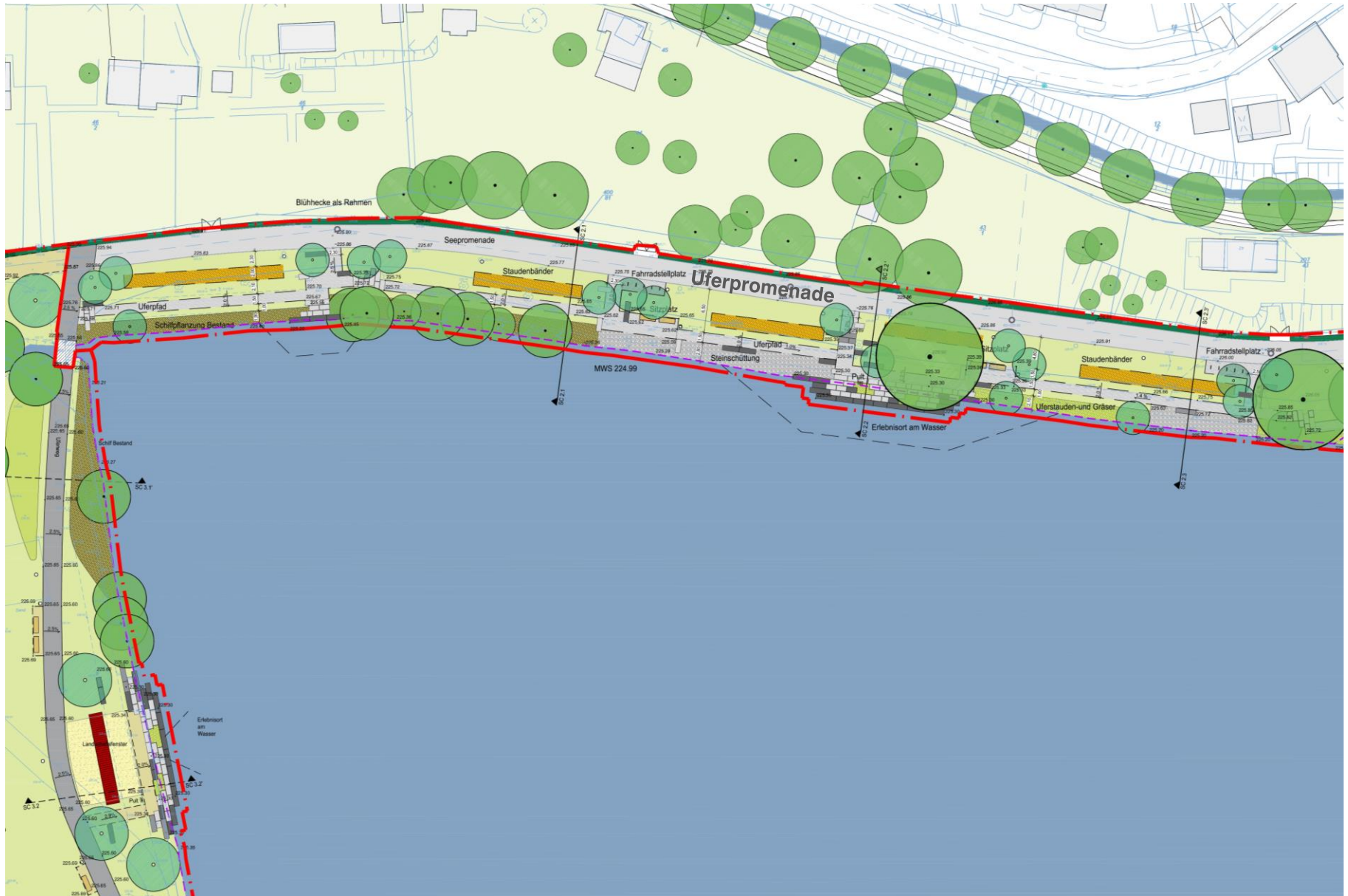
Entwurfsplanung 2. BA: Uferpromenade mit Ufergarten