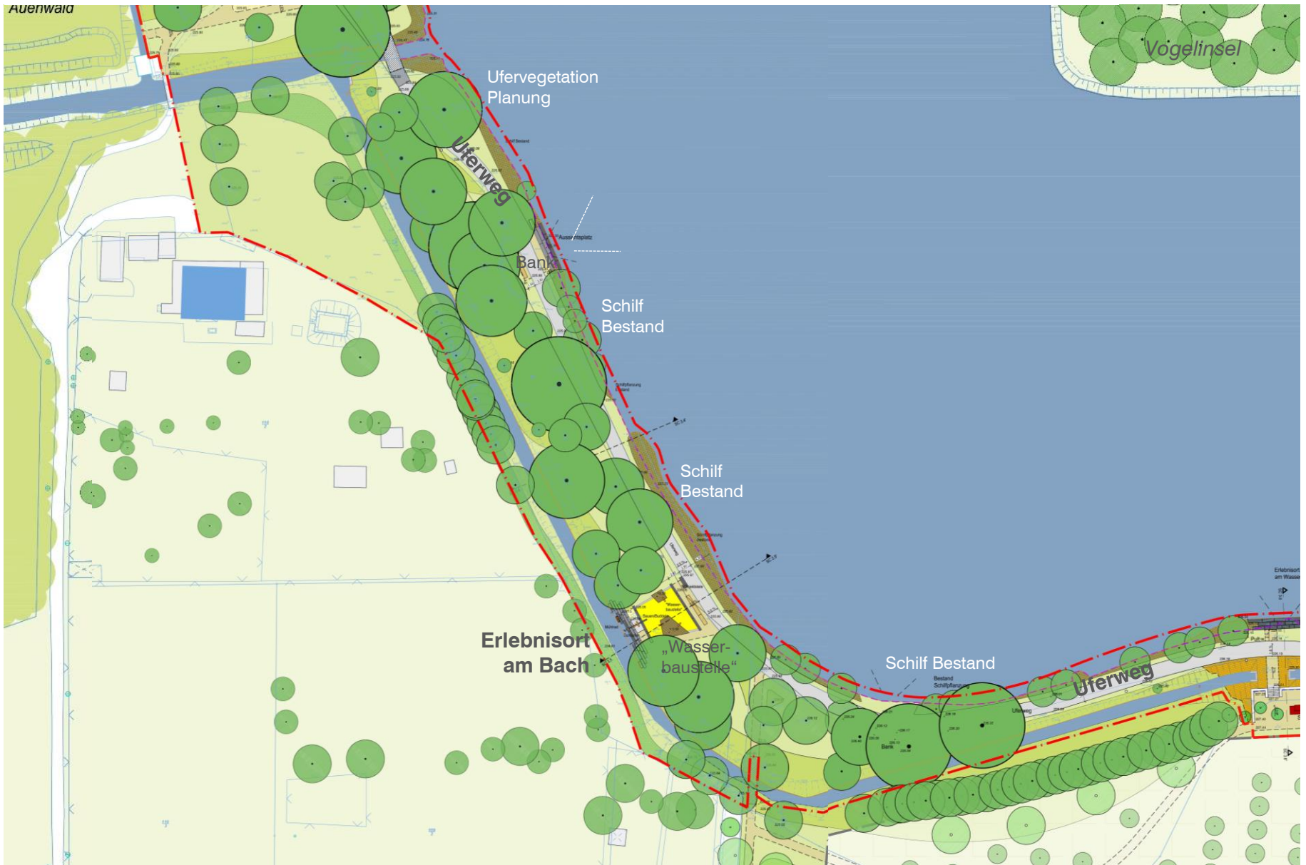
Entwurfsplanung 3.BA: Uferweg – Wiesen- und Naturerlebnis