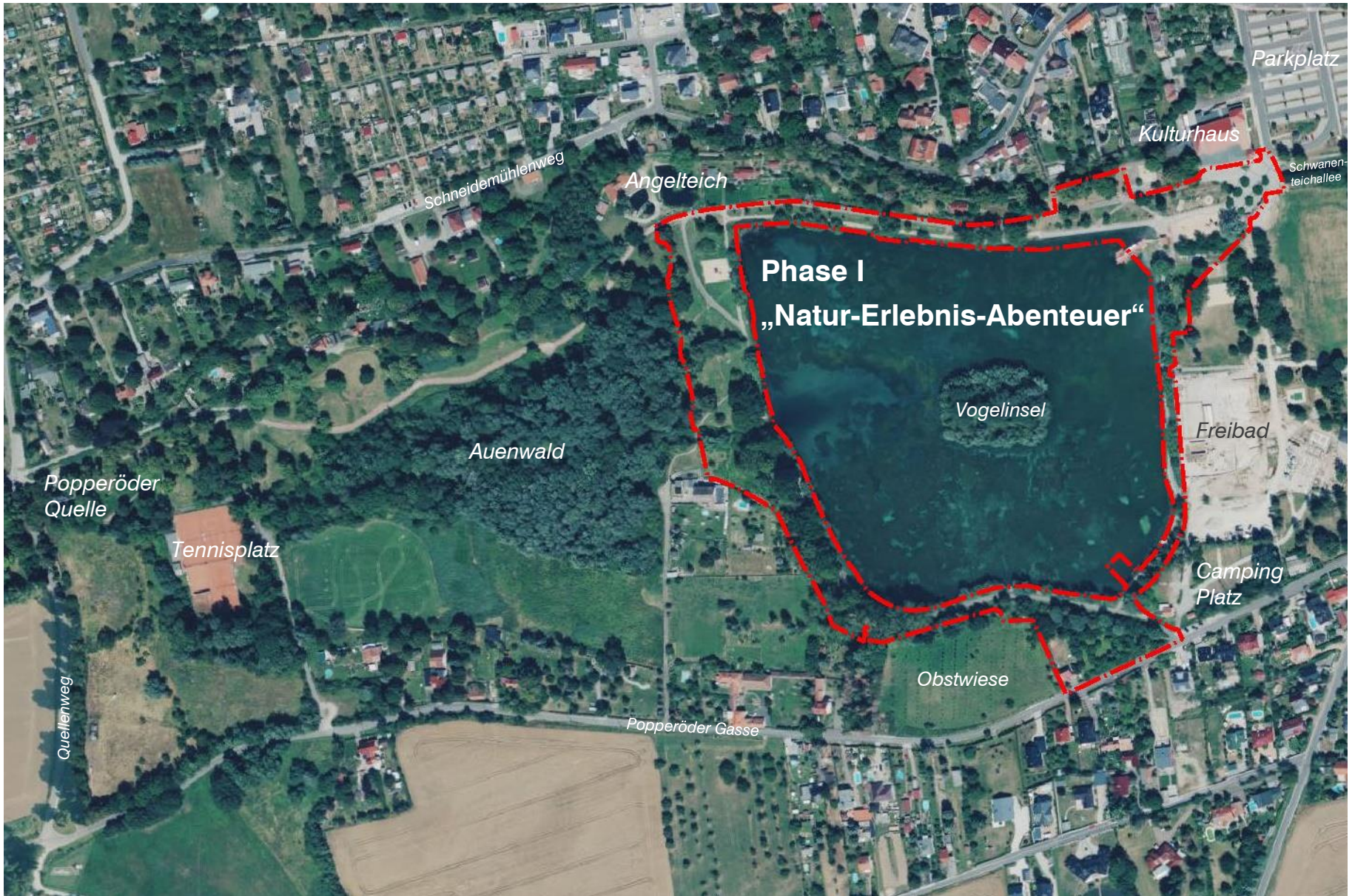
Übersicht: Planungsphase I