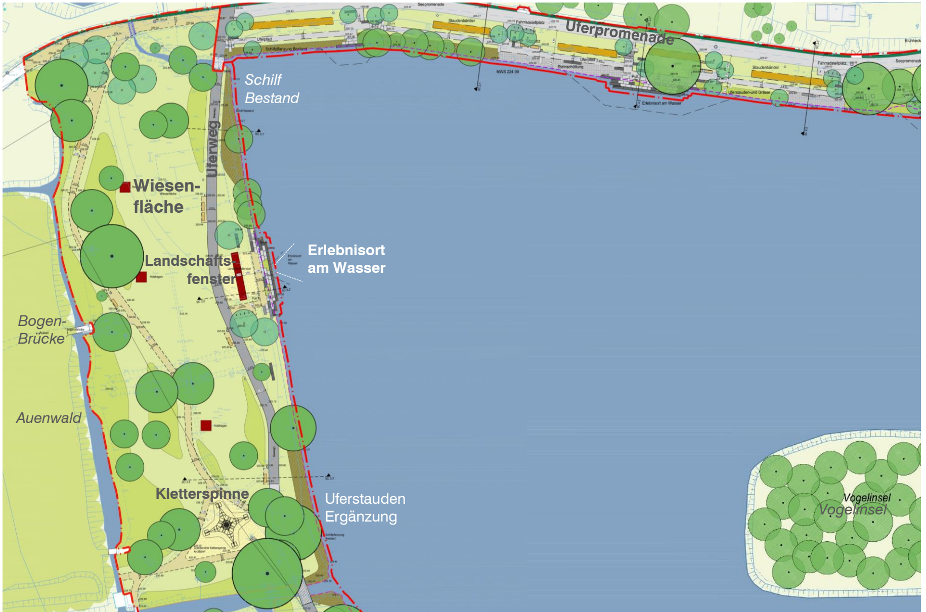
Entwurfsplanung 3.BA: Uferweg – Wiesen- und Naturerlebnis