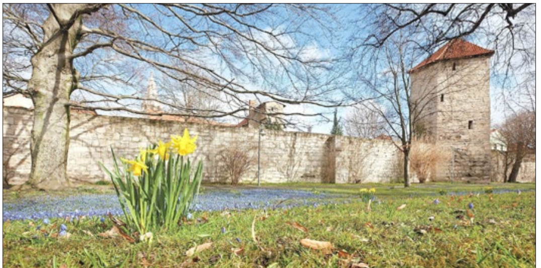
In Erinnerung an die Ereignisse von 1251 wurde am heutigen Lindenbühl eine Speisung mit Brot und Hering abgehalten.

das Engagement in unserer so vielseitigen Vereinslandschaft ist von unschätzbarem Wert für das Zusammenleben in unserer Stadt. Gegenseitige Unterstützung und Zusammenhalt sind heute gefragter denn je - und das war im Mittelalter nicht anders. So schaffte es die Mühlhäuser Bürgerschaft im Jahr 1251 am Freitag vor Palmsonntag mit vereinten Kräften, einen feindlichen Angriff nach Art des Trojanischen Pferdes abzuwehren. Dieser Erfolg verschaffte den Mühlhäusern eigene Freiheitsrechte und prägte die Erinnerung der Reichsstadt jahrhundertlang.