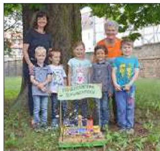
Die Kita St. Josef hat bereits einen tollen Beitrag abgegeben.

Mit Schere, Papier, Stift und ganz viel Kreativität und Fantasie waren die Mühlhäuser Kindergartenkinder auch in diesem Jahr aufgerufen, sich mit ihrer Heimatstadt auseinanderzusetzen - beim 8. Kita-Mal- und Bastelwettbewerb der Stadt Mühlhausen zum Thema „Neues Freibad am Schwanenteich“.