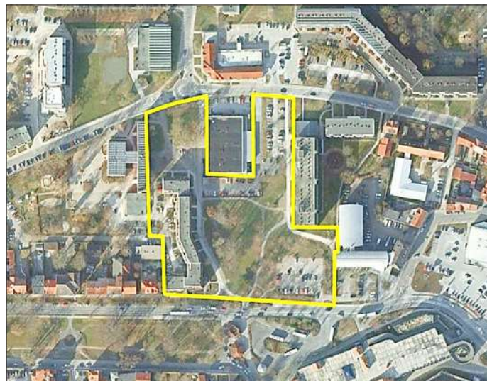
Übersicht Wettbewerbsgebiet An der Burg/Feldstraße