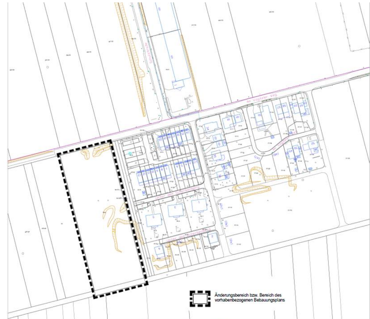
Aufstellung eines vorhabenbezogenen Bebauungsplans - B-Plan Nr. VEP-37 "Höngeda, Am Vogteier Weg" Übersichtsplan

Errichtung eines Wohnhauses, einer Kfz-Werkstatt/Halle und eines Reitplatzes mit dazu gehörenden Einrichtungen zu schaffen.